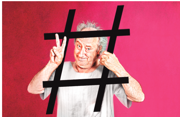
¡Que salga Aristófanes! Els Joglars