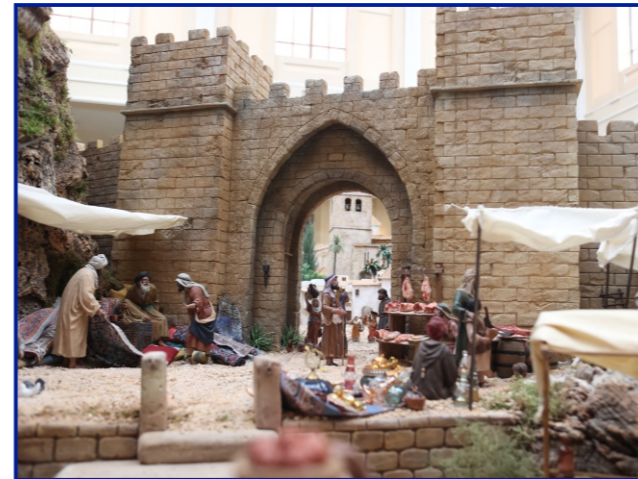
Belén Monumental Municipal 2021